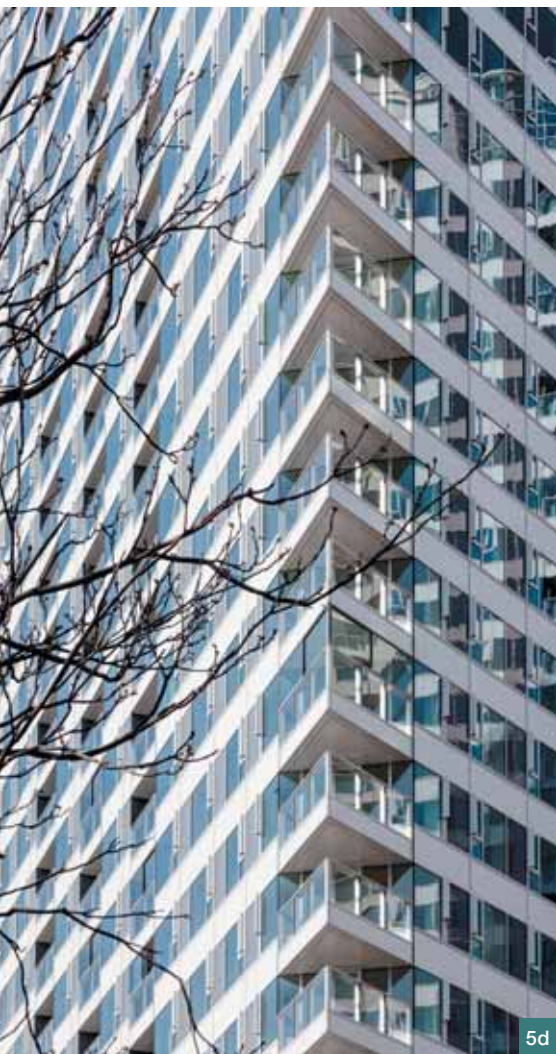
Obr. 5 Leto 2016: a) pohľad od Slovenského národného divadla, b) nárožie ulíc Landererova a Čulenova, c) pohľad na severnú fasádu z Landererovej ulice, d) detail rohových balkónov ■ Fig. 5 Summer 2016: a) view from the Slovak National Theatre, b) corner of the Landererova and Čulenova street, c) view to the northern facade from the Landererova street, d) detail of the corner balconies

vé pásma. Pri odpadných potrubíach splaškovej kanalizácie boli použité v bytových vežiach špeciálne tvarovky Sovent, umožňujúce značnú redukciu dimenzií odpadových potrubí.