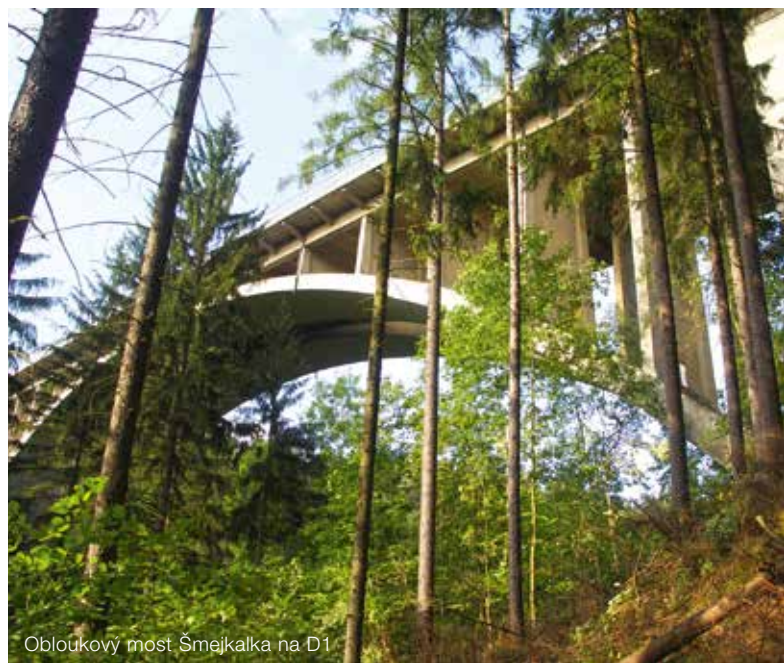
Obloukový most Šmejalka na D1