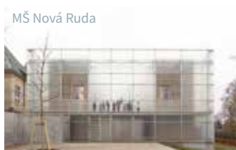
MŠ Nová Ruda