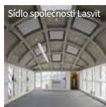
Sídllo společnosti Lasvit